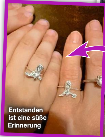
Entstanden ist eine süße Erinnerung