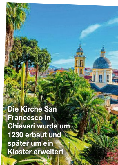
Die Kirche San Francesco in Chiavari wurde um 1230 erbaut und später um ein Kloster erweitert