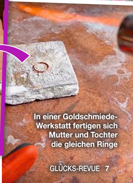
In einer Goldschmiede-Werkstatt fertigen sich Mutter und Tochter die gleichen Ringe