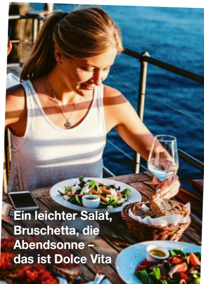
Ein leichter Salat, Bruschetta, die Abendsonne – das ist Dolce Vita