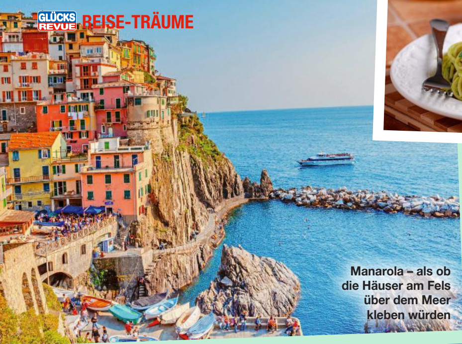
Manarola – als ob die Häuser am Fels über dem Meer kleben würden