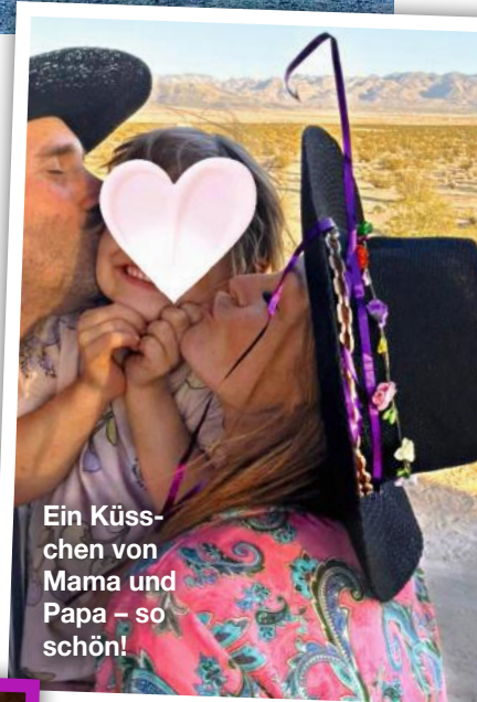
Ein Küsschen von Mama und Papa – so schön!