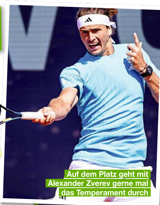
Auf dem Platz geht mit Alexander Zverev gerne mal das Temperament durch