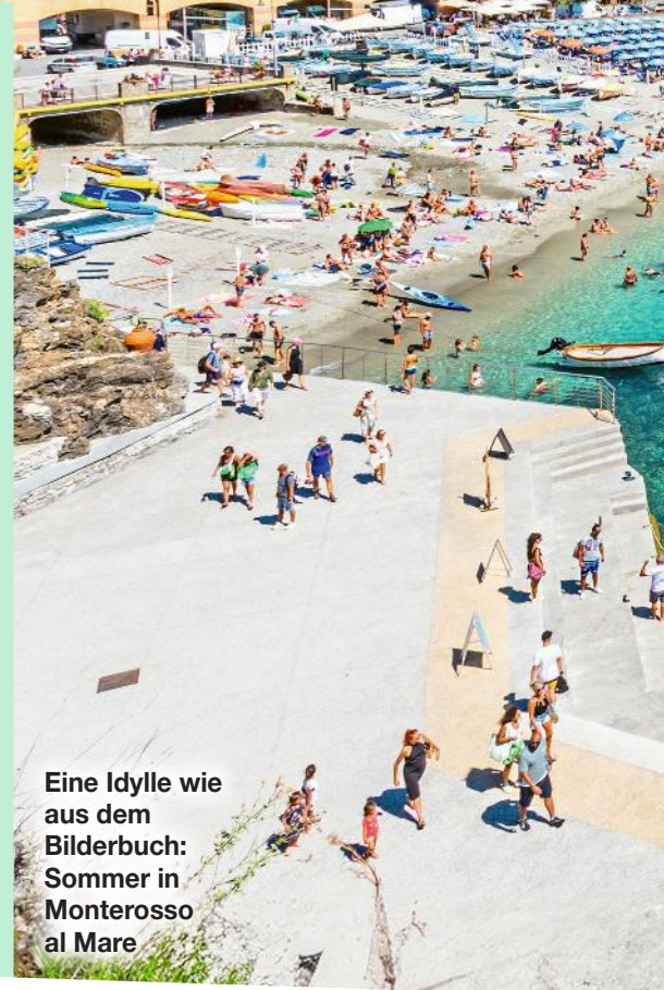
Eine Idylle wie aus dem Bilderbuch: Sommer in Monterosso al Mare