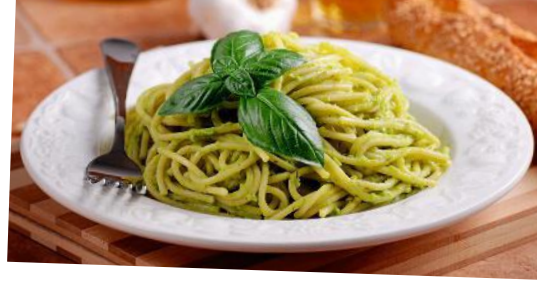
Die berühmte, feine Pesto-Soße wurde hier in Ligurien erfunden