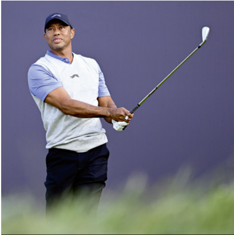
Geburtskind und Golf-Perle: Tiger Woods wurde kürzlich 50, der Prachtplatz La Mer von Golf du Touquet in Nordfrankreich.