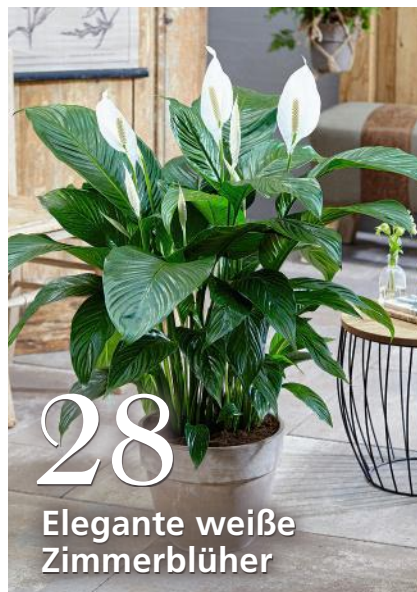
Elegante weiße Zimmerblüher