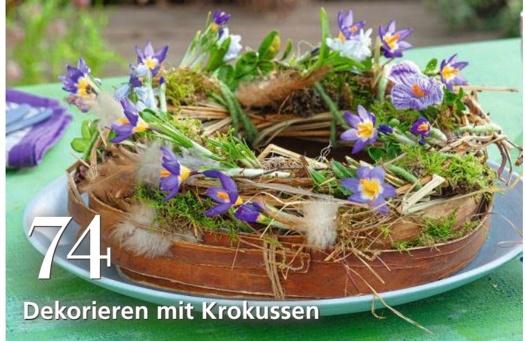
Dekorieren mit Krokussen