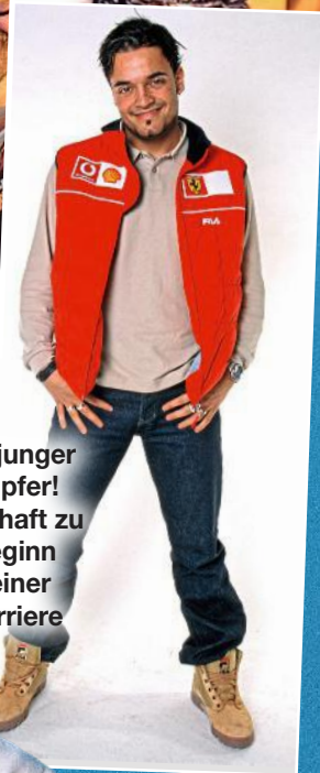
Ein junger Hüpfert! Bubihaft zu Beginn seiner Karriere