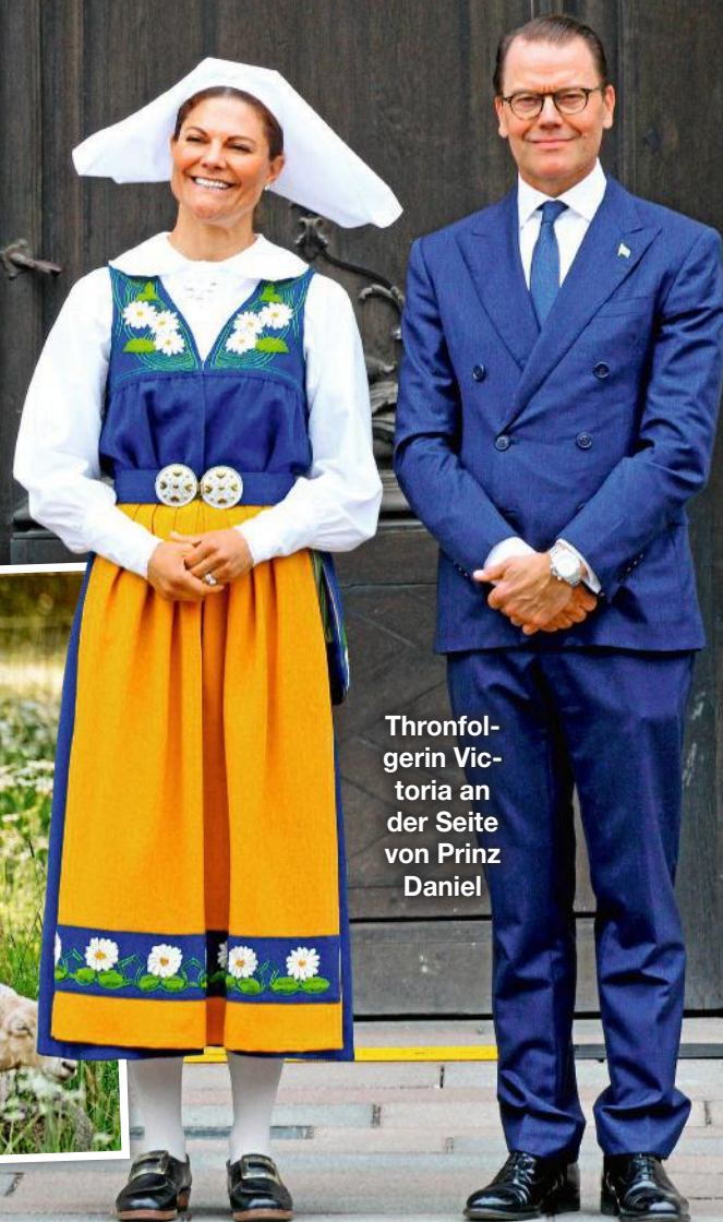
Thronfolgerin Victoria an der Seite von Prinz Daniel