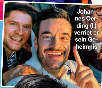
Johannes Oerding (l.) verriet er sein Geheimnis