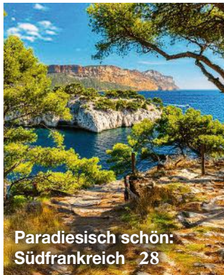
Paradiesisch schön: Südfrankreich 28