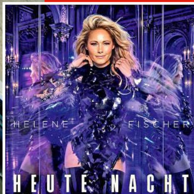
Helenes „neuer“ Song „Heute Nacht“ kletterte auf Platz 1 der Charts