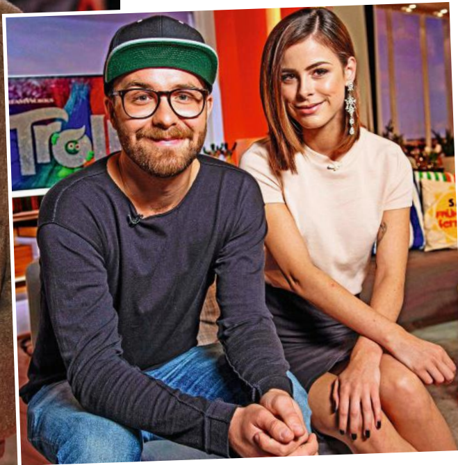
Mark Forster und seine Ehefrau Lena Meyer-Landrut erwarten ihr zweites Kind

Der Text scheint geradezu maßgeschneidert für ihn und seine Liebste zu sein: „Manchmal fühlt sich's an, als hätt' ich mein Herz geteilt. Als wär der Großteil nicht bei mir, sondern bei euch dreien“. Mit jedem dieser Worte zeigte er deutlich, wie sehr er sich auf ihr gemeinsames Leben mit dem kleinen Sohn und dem zweiten Baby freut! Ist der Song vielleicht sogar eine versteckte Botschaft? Womöglich