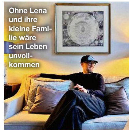
Ohne Lena und ihre kleine Familie wäre sein Leben unvollkommen