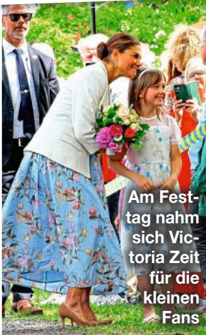
Am Festtag nahm sich Victoria Zeit für die kleinen Fans