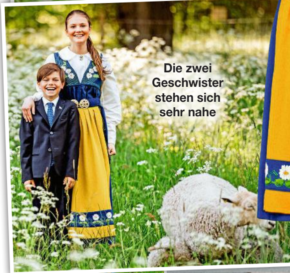
Die zwei Geschwister stehen sich sehr nahe