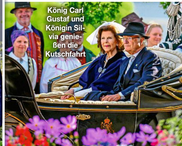
König Carl Gustaf und Königin Silvia genießen die Kutschfahrt