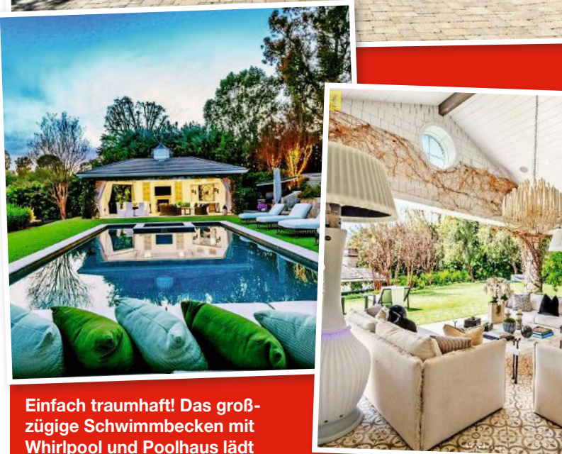
Einfach traumhaft! Das großzügige Schwimmbecken mit Whirlpool und Poolhaus lädt zum Chillen ein