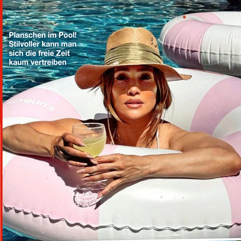
Planschen im Pool! Stilvoller kann man sich die freie Zeit kaum vertreiben