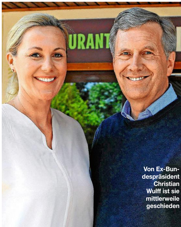
Von Ex-Bundespräsident Christian Wulff ist sie mittlerweile geschieden