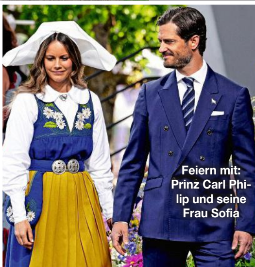
Feiern mit: Prinz Carl Philip und seine Frau Sofia