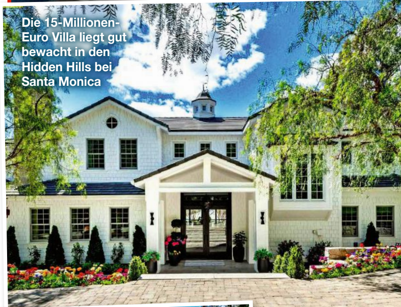
Die 15-Millionen-Euro Villa liegt gut bewacht in den Hidden Hills bei Santa Monica