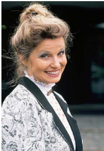
1988 bei einem Pressetermin für „Zahn um Zahn“, wo sie Victoria „Häppchen“ Happmeyer spielte