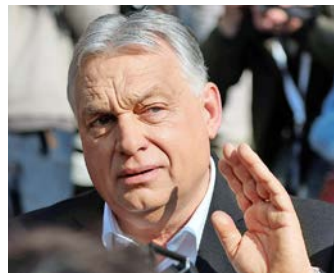
Viktor Orbán, 62, am Tag seiner Wahlniederlage in Ungarn

Innenpolitisch will Magyar die liberale Demokratie wiederherstellen, die er durch Orbáns Politik einer Gleichschaltung von Justiz und Medien stark geschädigt sieht.