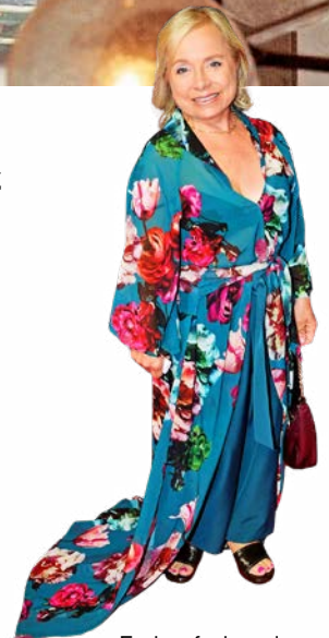
Farbenfroh und gut gelaunt im Europa-Park in Rust: TV-Star ChrisTine Urspruch (S. 86)

S. 24 Blick ins Land · S. 30 Witze der Woche · S. 31 Die Mami-Kolumne · S. 32 Leserbrief · S. 34 Horoskop & Rätselspaß · S. 37 Impressum · S. 48 Die Kinderseiten · S. 55 Preisinspektor · S. 58 Steuertipps · S. 59 Mein Haustier · S. 63 Garten & Balkon · S. 69 Medizin-News · S. 89 Die Kiwi-Kolumne