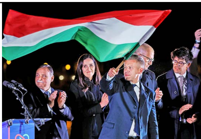
Péter Magyar schwenkt nach seinem Sieg die Fahne Ungarns

Vor genau 50 Jahren, am 21. April 1976, nahm die DDR die erste deutsche Antarktisstation in Betrieb. Diese wurde 1987 nach dem deutschen Naturforscher Georg Forster benannt. In der sogenannten Schirmacher-Oase im Osten der Antarktis erhielten die Wissenschaftler vor allem durch ihre präzisen Ozonmessungen internationale Anerkennung. Ein Großteil des Wissens über Ozonlöcher in den 1980er- und 1990er-Jahren geht auf diese Forschung zurück. Die Station bestand aus zehn Arbeits- und Wohncontainern sowie Generator- und Funkstationen. 1993 endete der Forschungsbetrieb, bis 1996 wurden rund 1 000 Tonnen Material und Müll mit russischer Hilfe abtransportiert – ein international gelobter Beitrag zum Umweltschutz in der Antarktis.