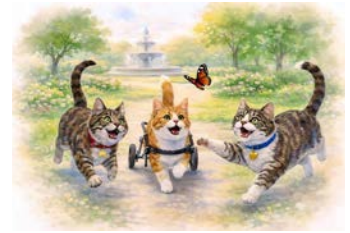
Es geht um Hilfsbereitschaft: eine Illustration aus „Hakuna & Matata. Abenteuer in London“ (22,50 Euro)