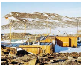
Die Forschungsstation der DDR in der Antarktis