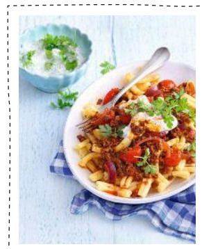
Das Titelbild fotografierte Mathias Neubauer (Rezept Seite 17)

*Zum Ortstarif, Mobilfunknetze können abweichen.