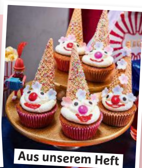
Aus unserem Heft