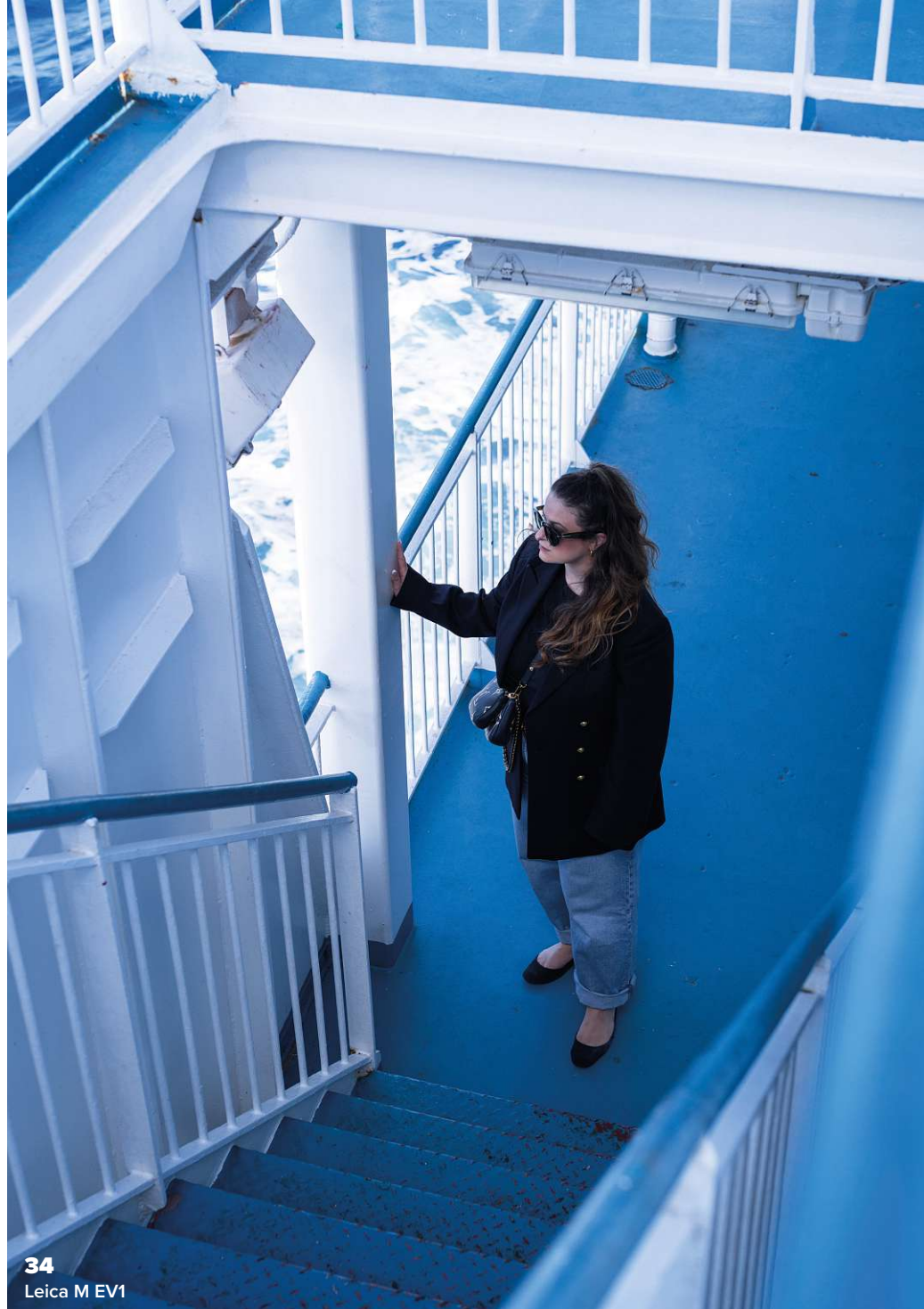
34 Leica M EV1