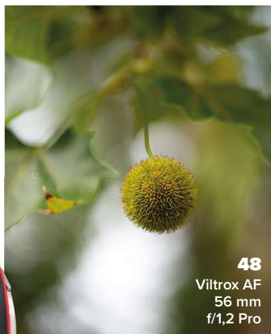
48 Viltrox AF 56 mm f/1,2 Pro