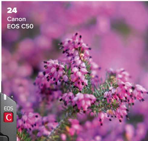
24 Canon EOS C50