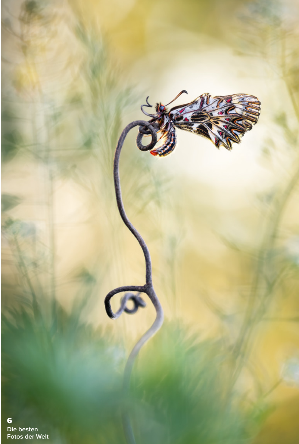
6 Die besten Fotos der Welt