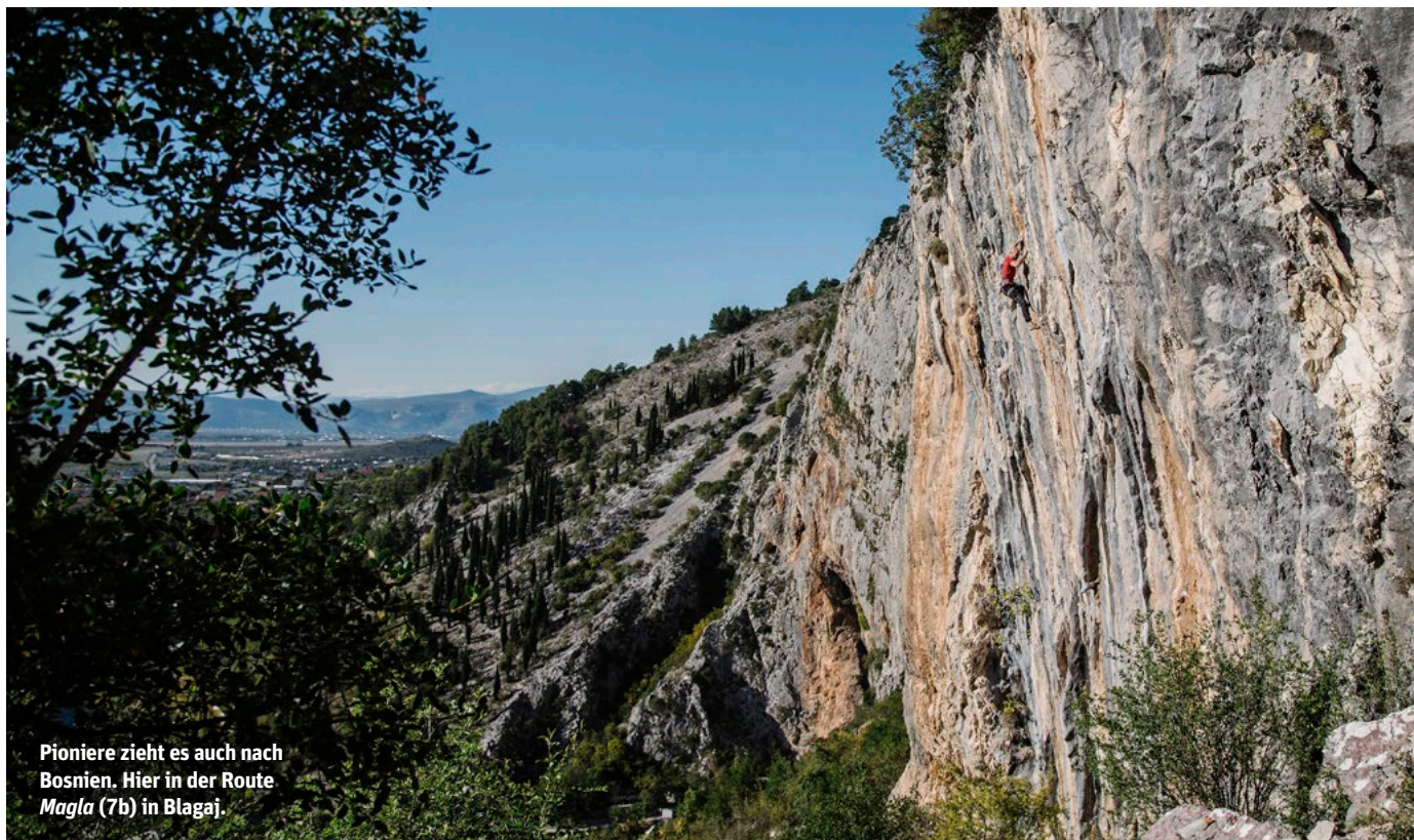
Pioniere zieht es auch nach Bosnien. Hier in der Route Magla (7b) in Blagaj.