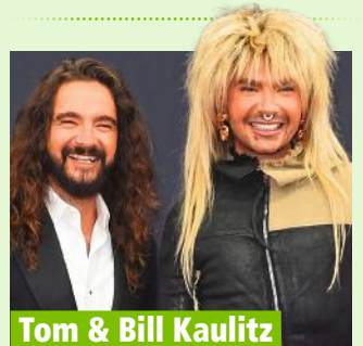
Tom & Bill Kaulitz