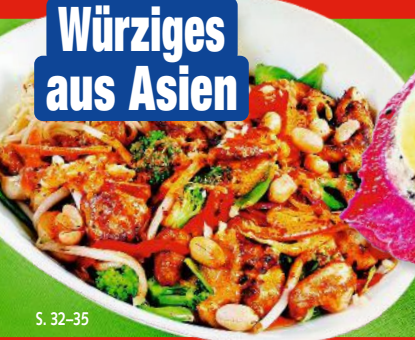
Würziges aus Asien