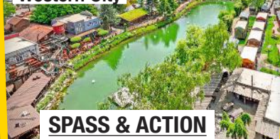
Europa Park mit Western City