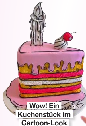
Wow! Ein Kuchenstück im Cartoon-Look