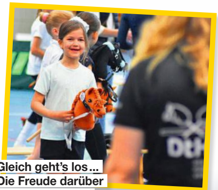
Gleich geht's los... Die Freude darüber steht der Kleinen ins Gesicht geschrieben