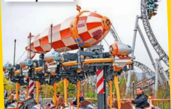
Rasant: Luftikus in Tripsdrill