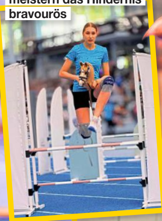
Hochkonzentriert geht die Sportlerin in Gedanken den Parcours durch