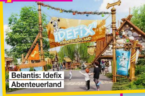
Belantis: Idefix Abenteuerland

● Hansa-Park. Die neue Familienachterbahn „Cornwall