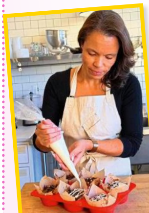
Cupcakes gibt es schon ab zwei Dollar (ca. 1,75 €) – Torten hingegen kosten zwischen 75 und 7.500 Dollar (ca. 65 bis 6.480 €)