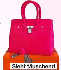
Sieht täuschend echt aus – aber diese Birkin-Tasche ist zum Vernaschen