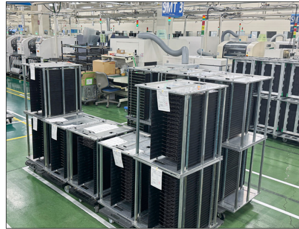
Fertige Platinen warten in Kisten auf ihren Einbau - dahinter die Geräte für ihre Bestückung.

Tonabnehmer von Hand verlötet werden. Gleich nebenan ist auch der abschließende Funktionstest.