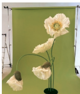
Diese schönen Papierblumen waren Teil unserer Beauty-Produktion. Mehr ab S. 68