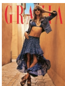
Unser Covermodel Suki Waterhouse trägt einen Look von Michael Kors