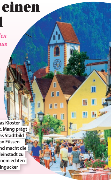
Das Kloster St. Mang prägt das Stadtbild von Füssen – und macht die Kleinstadt zu einem echten Hingucker

Klein, aber oho: Fünf deutsche Städte gehen in den sozialen Medien gerade richtig durch die Decke – aus gutem Grund. Ob traumhafte Altstädte, frische Meeresluft oder idyllische Weinberge: Hier stimmt einfach die Kulisse für eine erholsame Auszeit. Ganz vorn mit dabei ist Füssen: Alpenpanorama inklusive Märchenschloss-Blick. Ebenfalls fotogen: Rothenburg ob der Tauber mit mittelalterlicher Bilderbuch-Altstadt. Wer lieber ans Meer möchte, wird in Kühlungsborn fündig: Promenade, Strand, Ostsee-Feeling pur. Für Aktivurlaub und Natur ist Winterberg im Sauerland perfekt. Und am Bodensee lockt Meersburg mit Weinbergen, Seeblick und charmanten Gassen. Fazit: Tolle Reisefreuden gibt's auch im Verborgenen – man muss nur wissen, wohin.