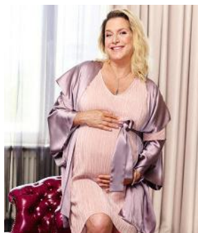
VOR-FREUDE Schauspielerin und Sängerin Jeanette Biedermann erwartet mit 46 Jahren ihr erstes Kind