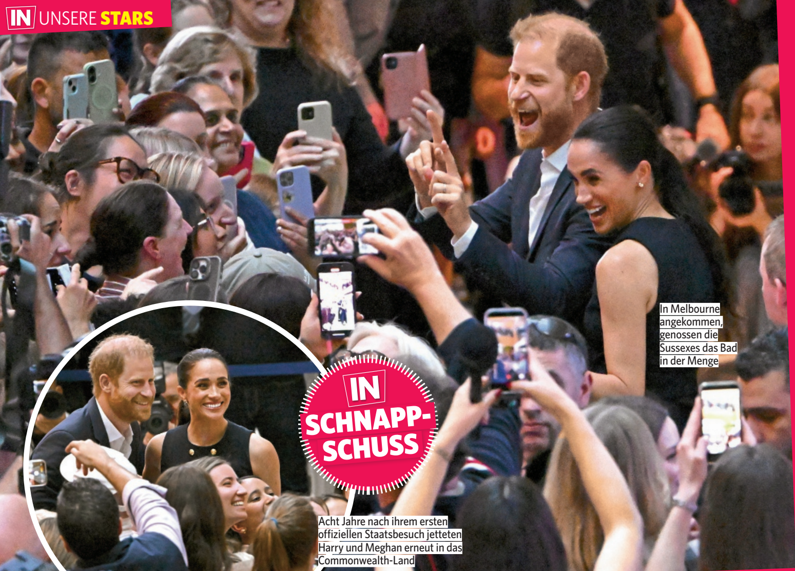
In Melbourne angekommen, genossen die Sussexes das Bad in der Menge