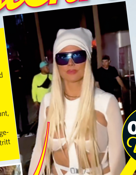
HEIDI KLUM (52)

Glitzer, Wüsten-Vibes und jede Menge Stars: Beim Coachella wurde wieder gefeiert, was das Zeug hält! Heidi Klum überraschte inkognito in wilden Looks, während Jennifer Lopez ihr Festival-Debüt im Boho-Style zelebrierte. Paris Hilton präsentierte sich als schillernde Barbie gewohnt extravagant, Kylie Jenner fieberte in lässiger Fan-Kluft dem „Biebercella“ entgegen – dem viel diskutierten Auftritt von Justin Bieber (32).