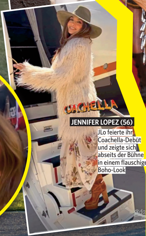
JENNIFER LOPEZ (56)

JLo feierte ihr Coachella-Debüt und zeigte sich abseits der Bühne in einem flauschigen Boho-Look