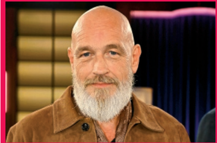
TORSTEN STRÄTER (59)

Die Schauspielerin hat verraten, dass sie nur noch bequeme Bodys anziehe. „Ich trage keinen BH mehr. Ich bin zu alt dafür. Mir egal, ob der Busen bis zu den Knien hängt.“