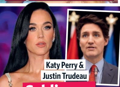
Katy Perry & Justin Trudeau

Darum ist sie wieder in der Psycho-Klinik