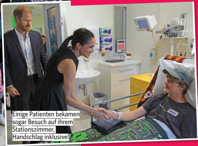
Einige Patienten bekamen sogar Besuch auf ihrem Stationszimmer, Handschlag inklusive!

Bei ihrem Besuch in Australien wurden Prinz Harry und Herzogin Meghan empfangen, als wären sie noch im Dienste der britischen Krone unterwegs. Dabei hatten sie 2020 ihren royalen Dienst quittiert! Die Reise nach Down Under absolvierten sie angeblich, um den dort besuchten Vereinen und Organisationen größere Aufmerksamkeit zu schenken.