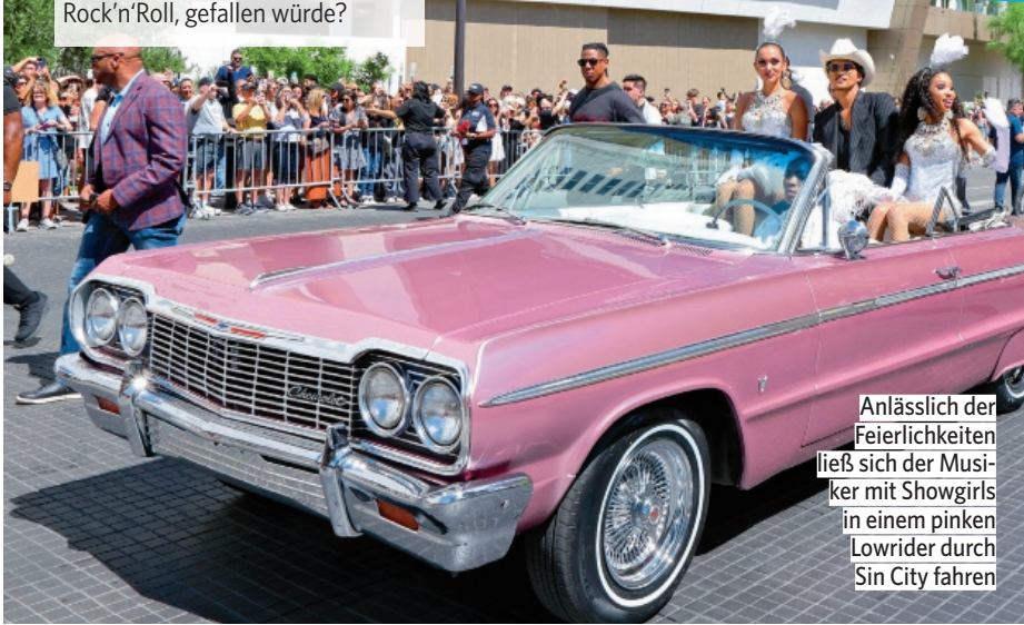
Anlässlich der Feierlichkeiten ließ sich der Musiker mit Showgirls in einem pinken Lowrider durch Sin City fahren