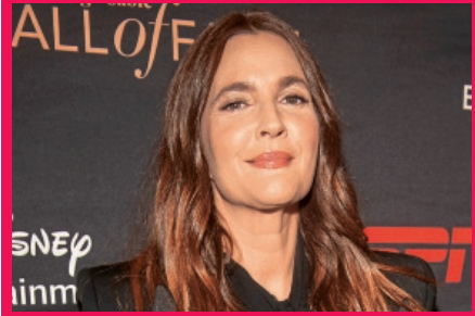
DREW BARRYMORE (51)

Was passierte sonst noch bei den Stars? IN hat die wichtigsten News der Woche zusammengefasst