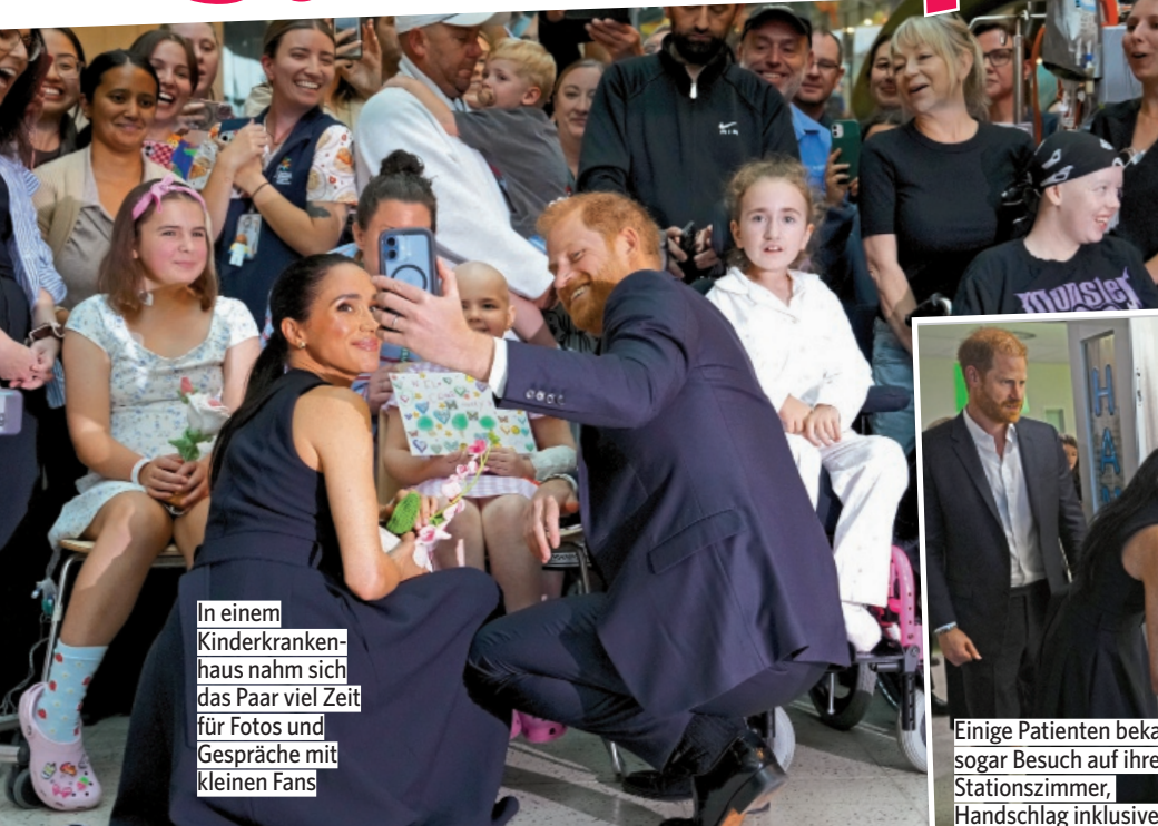
In einem Kinderkrankenhaus nahm sich das Paar viel Zeit für Fotos und Gespräche mit kleinen Fans

Bei ihrem Besuch in Australien wurden Prinz Harry und Herzogin Meghan empfangen, als wären sie noch im Dienste der britischen Krone unterwegs. Dabei hatten sie 2020 ihren royalen Dienst quittiert! Die Reise nach Down Under absolvierten sie angeblich, um den dort besuchten Vereinen und Organisationen größere Aufmerksamkeit zu schenken.