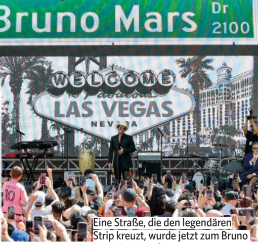
Eine Straße, die den legendären Strip kreuzt, wurde jetzt zum Bruno Mars Drive umbenannt

In Las Vegas wurde der Sänger mit einer großen Parade auf dem berühmten Strip gefeiert: Bruno Mars bekam nicht nur seine eigene Straße in der Wüstenmetropole, die Stadt erklärte ihn sogar offiziell zum „New King of Las Vegas“. Ob das Elvis, dem King of Rock'n'Roll, gefallen würde?