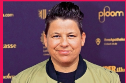
KERSTIN OTT (44)

Der Komiker hat bekanntgegeben, dass er sich zurzeit in ärztlicher Behandlung befinde, da bei ihm Krebs entdeckt wurde. Nächsten Monat will er aber wieder auf der Bühne stehen.