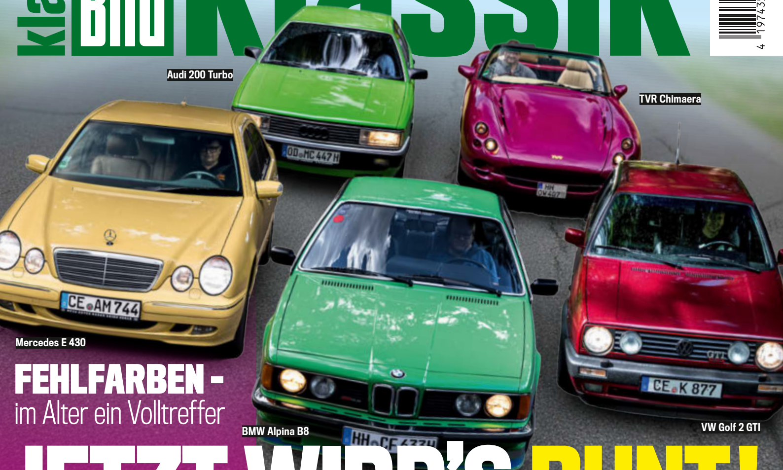
Audi 200 Turbo