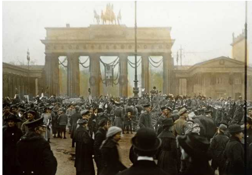
Heimkehrende Truppen, Bevölkerung vor dem Brandenburger Tor in Berlin im November 1918: Emotional aufgeladen und kompliziert

Erleben die Deutschen eine Zeitenwende? Und wenn ja, die wievielte? Als Reaktion auf den russischen Angriff gegen die Ukraine im Februar 2022 versprach der damalige Bundeskanzler Olaf Scholz in einer schon jetzt historischen Rede eine neue Verteidigungspolitik. Seitdem diskutieren die Deutschen wieder über ihre Armee, über Milliarden für Kampfjets, »Kriegstüchtigkeit« und die Rückkehr zur Wehrpflicht. Die einst belächelte Bundeswehr soll, so fordert es Bundeskanzler Friedrich Merz, zur stärksten konventionellen Armee Europas werden.