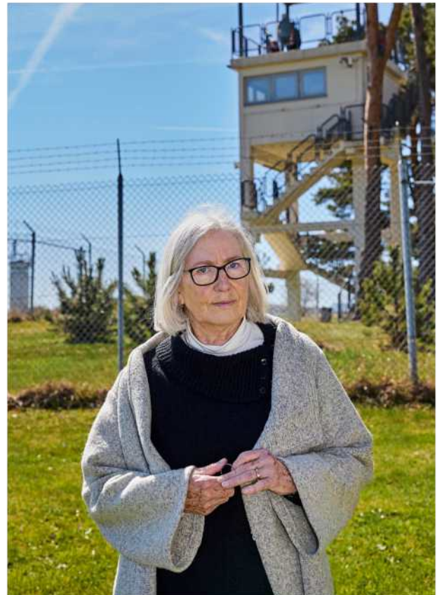
Angst In Osthessen wäre der Kalte Krieg eskaliert. Das wirkt bis heute nach. Seite 108