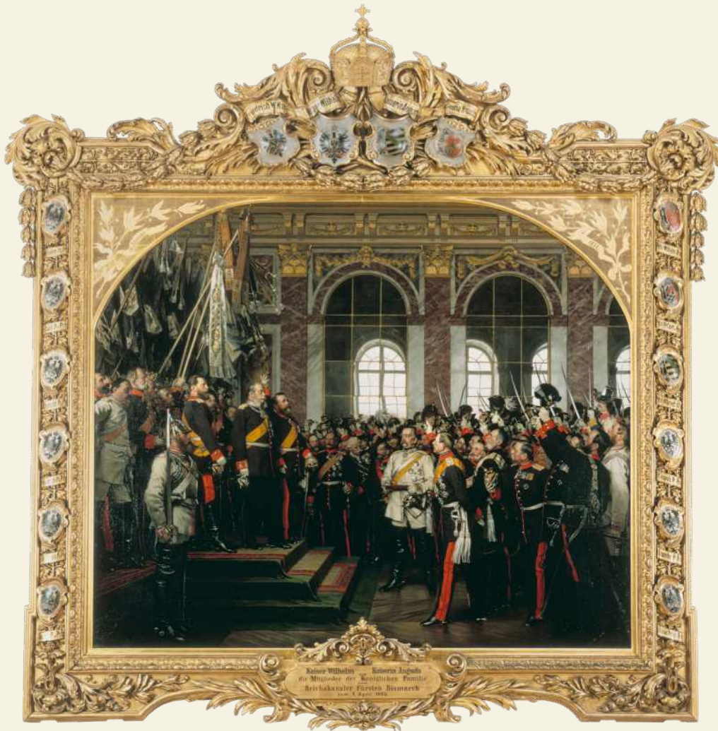
Ausrufung des deutschen Kaiserreichs im Spiegelsaal von Versailles 1871: Plötzlich Großmacht

Zusammenhalt Kleider machen Leute, heißt es. Und das Militär? Formte in Deutschland eine ganze Gesellschaft: strebsam, effizient und fortschrittlich, aber auch autoritätshörig. Uniformen machten aus Bürgern Soldaten. Die Armee wurde spätestens mit dem Sieg über Frankreich 1871 zum Stolz der Nation – und nach den Verbrechen der Wehrmacht zu ihrer Schande.