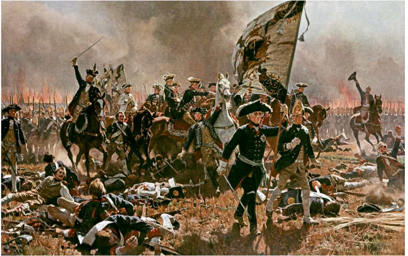
Expansionsdrang Preußens Militär war sehr erfolgreich – und schuf eine spezielle Kultur im Staat. Seite 28