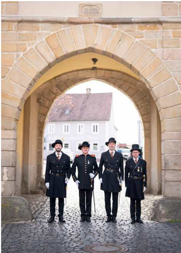
Demokratietradition Im bayerischen Königsberg schützte eine Bürgerwehr das Gemeinwesen. Seite 46