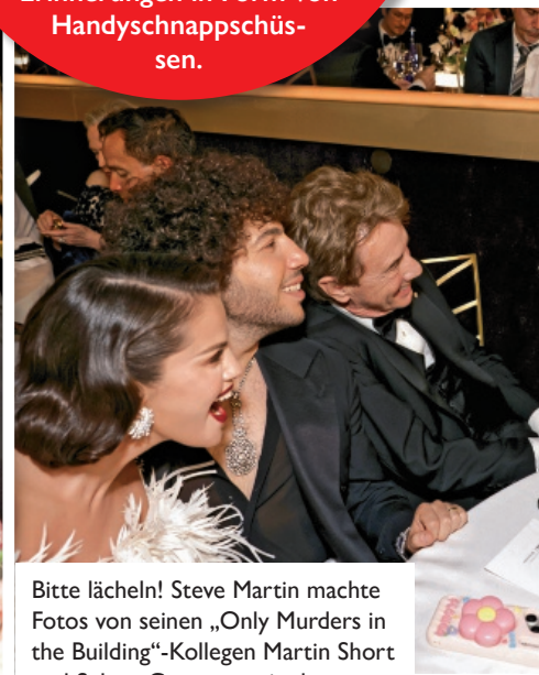
Bitte lächeln! Steve Martin machte Fotos von seinen „Only Murders in the Building“-Kollegen Martin Short und Selena Gomez sowie deren Ehemann Benny Blanco (2. v.l.)

» Nach der Preisverleihung ging die Party richtig los! Vor der Champagner-Bar tummelten sich Stars wie Ariana Grande (32), Kate Hudson (46) oder Emma Stone (37). Andere, wie Julia Roberts (58) oder George Clooney (64) ließen sich das edle Tröpfchen am Tisch gut schmecken oder sammelten Erinnerungen in Form von Handschnappschüssen.