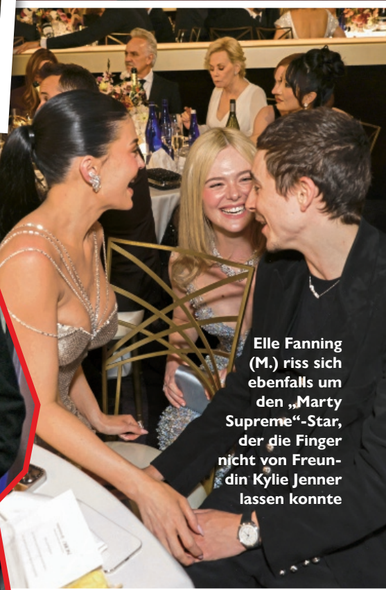
Elle Fanning (M.) riss sich ebenfalls um den „Marty Supreme“-Star, der die Finger nicht von Freundin Kylie Jenner lassen konnte