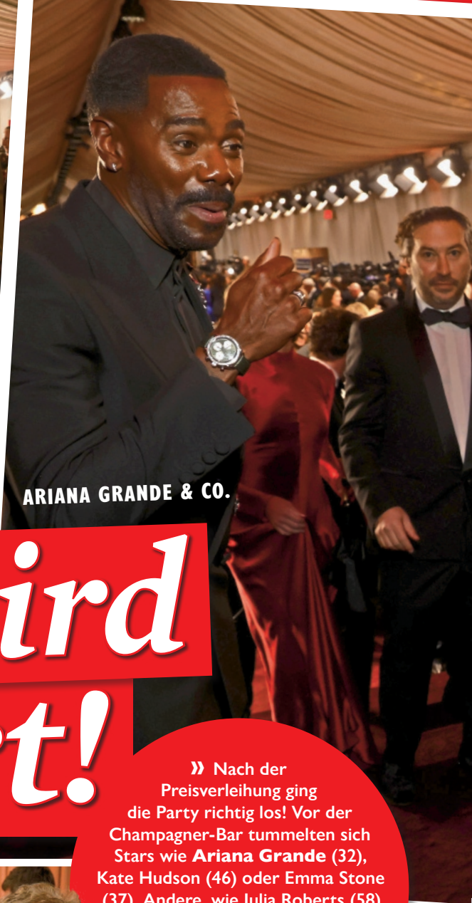
ARIANA GRANDE & CO.