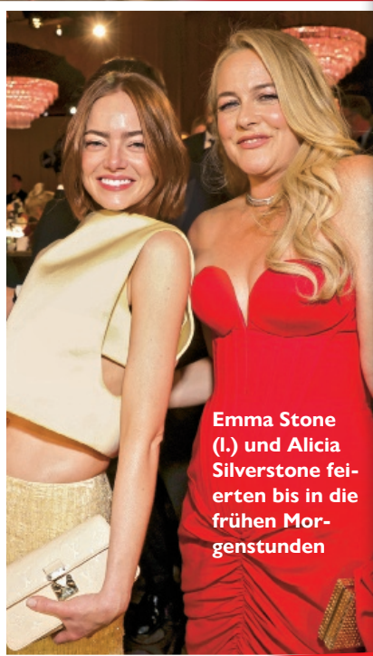
Emma Stone (l.) und Alicia Silverstone feierten bis in die frühen Morgenstunden