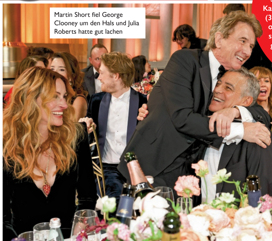
Martin Short fiel George Clooney um den Hals und Julia Roberts hatte gut lachen

» Nach der Preisverleihung ging die Party richtig los! Vor der Champagner-Bar tummelten sich Stars wie Ariana Grande (32), Kate Hudson (46) oder Emma Stone (37). Andere, wie Julia Roberts (58) oder George Clooney (64) ließen sich das edle Tröpfchen am Tisch gut schmecken oder sammelten Erinnerungen in Form von Handschnappschüssen.