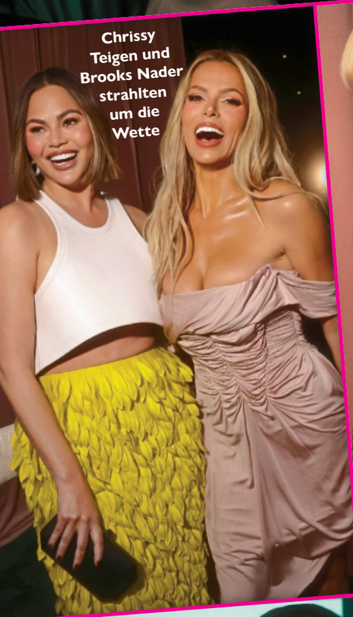
Chrissy Teigen und Brooks Nader strahlten um die Wette