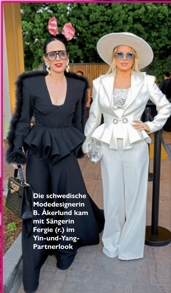
Die schwedische Modedesignerin B. Åkerlund kam mit Sängerin Fergie (r.) im Yin-und-Yang-Partnerlook