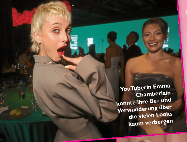
Youtuberin Emma Chamberlain konnte ihre Be- und Verwunderung über die vielen Looks kaum verbergen