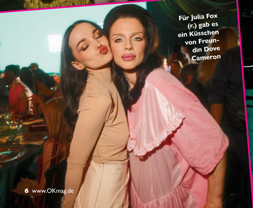
Für Julia Fox (r.) gab es ein Küsschen von Freundin Dove Cameron