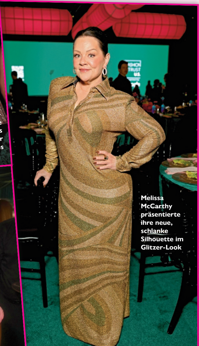
Melissa McCarthy präsentierte ihre neue, schlanke Silhouette im Glitzer-Look