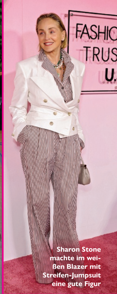
Sharon Stone machte im weißen Blazer mit Streifen-Jumpsuit eine gute Figur