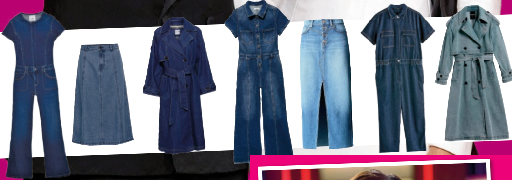
WE LOVE JEANS Die schönsten Maxiröcke, Overalls und Trenchcoats für den Frühling