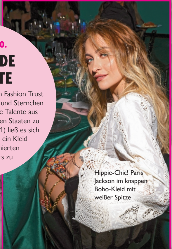
Hippie-Chic! Paris Jackson im knappen Boho-Kleid mit weißer Spitze

» LOS ANGELES Zu den Fashion Trust U.S. Awards kamen die Stars und Sternchen in Scharen, um aufstrebende Talente aus der Modewelt der Vereinigten Staaten zu ehren. Winnie Harlow (31) ließ es sich trotzdem nicht nehmen, ein Kleid eines bereits renommierten britischen Designers zu tragen.