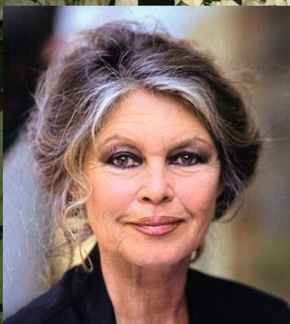
BRIGITTE BARDOT (†)

DIE BUNTE-DIÄT Gesund abnehmen mit der NiMe-Methode