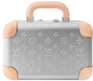
Alles hübsch verstaut: Vanity Case „Horizon“ aus Aluminium, von LOUIS VUITTON , um 2800 €