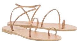
Immer die Richtigen: Sandalen „Eleftheria“ von ANCIENT GREEK SANDALS , um 215 €