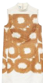
Print in Zimt: Minikleid aus Canvas, von PRADA , um 2400 €