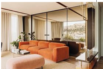
Mitten in Athens Kreativszene: Hotel PERIANTH , DZ ab 174 €/Nacht, über designhotels.com