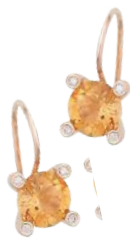
Meine Glow-Pieces: Ohr-ringe „Phlox“, mit Citrin und Diamanten, von BRON , um 3500 €