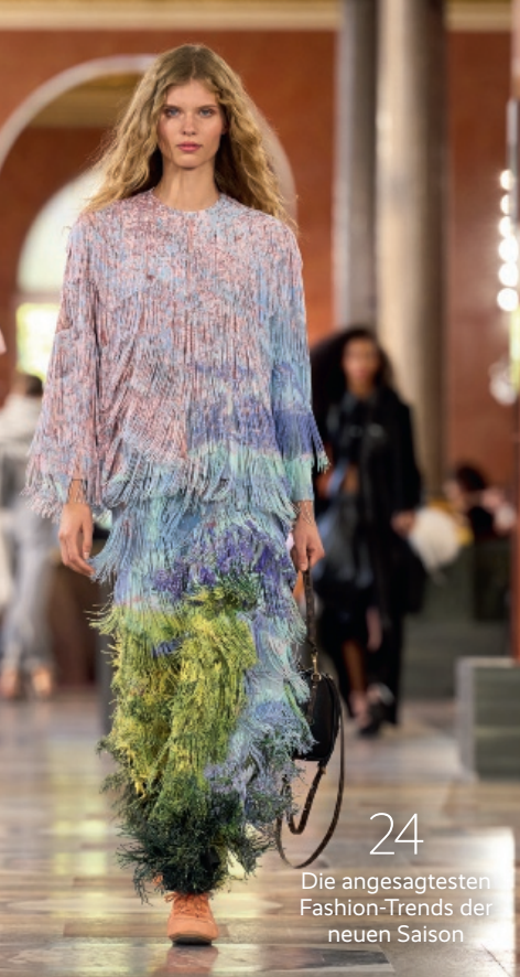
24 Die angesagtesten Fashion-Trends der neuen Saison