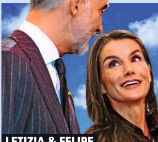
LETIZIA & FELIPE