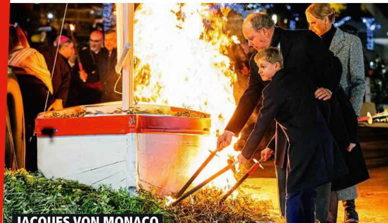
JACQUES VON MONACO

Die Gitarre ließ er zu Hause! Bei der Nürnberger Spielwarenmesse lächelte Sänger Peter Maffay (76) mit Theodore, einem interaktiven Audio-Kuschelbären. Ein Geschenk für Tochter Anouk (7)?