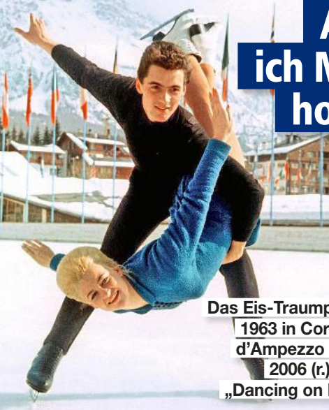
Das Eis-Traum-paar 1963 in Cortina d'Ampezzo und 2006 (r.) bei „Dancing on Ice“

Aber gut, dass ich Marika nicht mehr hochheben muss!