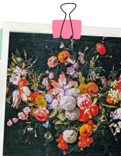
Barocke Blütenbilder im Wallraf-Richartz-Museum

Bis 11. Januar verwandelt das Event „Winterlicher“ den Palmgarten in eine leuchtende, idyllische Gartenlandschaft. palmgarten.de