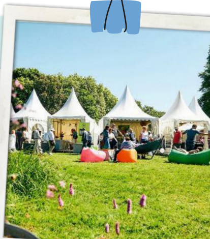
Das „Gartenfestival“ in Herrenhausen

Etwa 120 Aussteller präsentieren vom 1. bis zum 3. Mai auf dem Landgut Krumme beim „Waldgartenmarkt“ Deko, Möbel und mehr. waldgartenmarkt.de