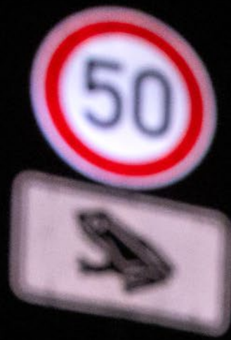
Aufnahmedaten: Canon EOS R5, 24 mm, 1/160 Sek., F 6.9, ISO 6400

Eine Straße zu überqueren, gehört wohl zum gefährlichsten Teil der Wanderung zum Laichgewässer. Erreicht dieses Erdkrötenpaar die andere Seite unbeschadet, steht der Gründung der nächsten Generation nichts mehr im Weg.