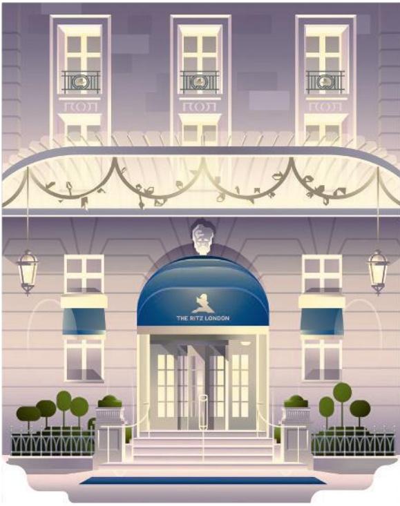
The Ritz London