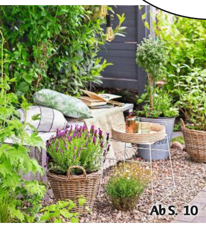
Ab S. 10

Wohlfühlen im Freien: Sitzplätze kreativ gestalten