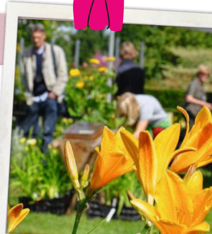
„Taglilientag“ im Park der Gärten

Am 4. und 5. Juli kann man beim „Mainufer Gartenfest“ an der Uferpromenade nach Herzenslust Rosen, Stauden und mehr shoppen. rosenmesse.de