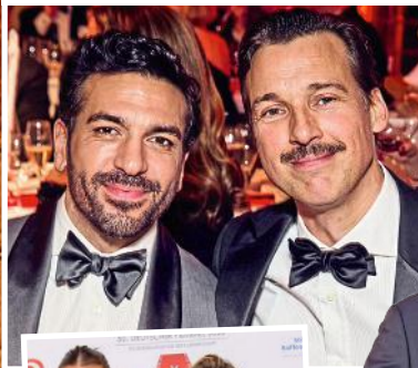
Fliegen-Freunde: Elyas M'Barek und Florian David Fitz