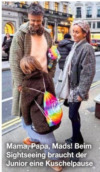
Mama, Papa, Mads! Beim Sightseeing braucht der Junior eine Kuschelpause

Er hat das Jugend-Gen! Howie feierte gerade seinen 80. Geburtstag