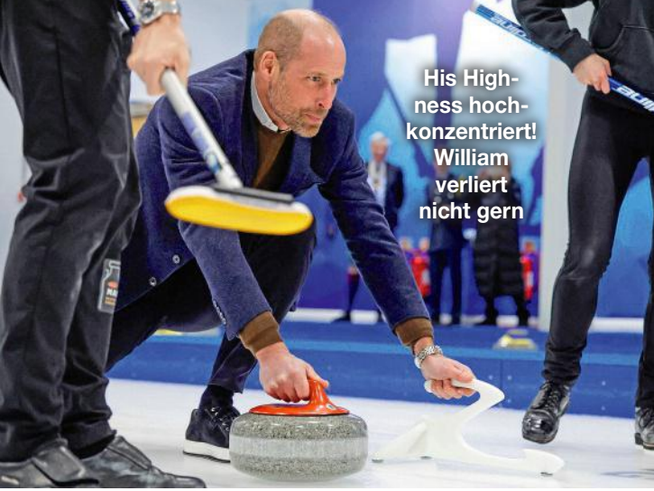
His Highness hochkonzentriert! William verliert nicht gern