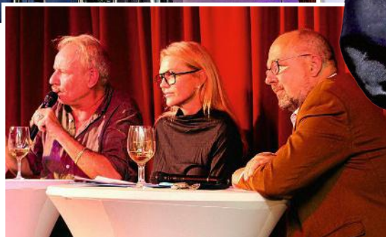
Die Schauspielerin inmitten der Theater-Verantwortlichen bei der Diskussion