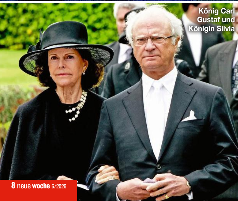
König Carl Gustaf und Königin Silvia

Arme Victoria, ihr stehen harte Zeiten bevor!