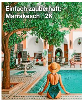
Einfach zauberhaft: Marrakesch 28

22 Fashion Marine-Looks mit Charme. Ein Klassiker für jede Jahreszeit 24 Beauty Richtige Reinigung – schönere Haut! Putz-Strategien für frischen Teint