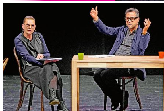
Auf der Bühne zu Hause: Anna und Ehemann Jan Josef Liefers