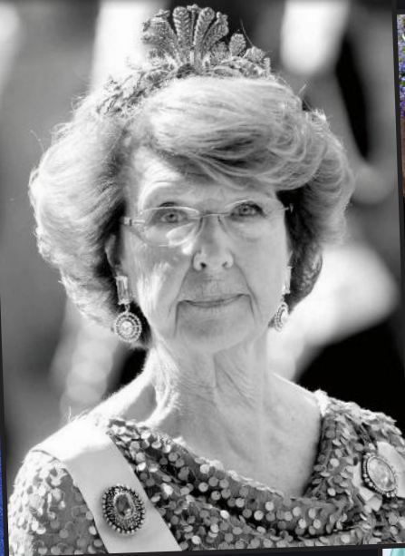
Prinzessin Désirée (†), die Schwester des Königs und Victorias Patentante