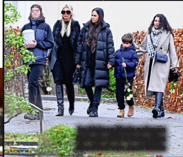
„Mein kleiner Kreis nehmen Abschied von Jack White“