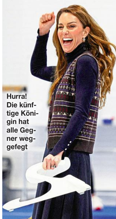
Hurra! Die künftige Königin hat alle Gegner weggefegt

Olaf, pardon William, mach Platz! Wie der lustige Schneemann aus dem Disney-Klassiker kam der Prinz von Wales (43) natürlich nicht daher, doch seine Ehefrau Prinzessin Kate (44) war trotzdem dann ein bisschen cooler! Eigentlich wollte das Paar beim Besuch der National Curling Academy in Schottland den Olympischen und Paralympischen Teams von Großbritannien Glück für die kommenden Winterspiele wünschen. Doch daraus wurde ein royaler Familien-Curling-Wettkampf, den Eiskönigin Kate nach anfänglichem Straucheln gewann. Yes – ihre Freude darüber war so herzerwärmend, besonders für „Verlierer“ William. Wie schön, dass die Dreifach-Mama trotz ihrer schweren Krebs-Erkrankung nichts von ihrem Siegeswillen eingebüßt hat!