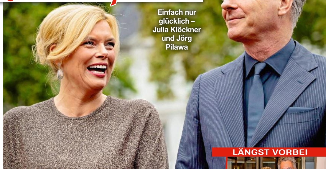
Einfach nur glücklich – Julia Klöckner und Jörg Pilawa

Warum nicht! Schließlich haben beide ihr Herz an den Kontinent schon längst verloren. Nicht nur Julia Klöckner heiratete 2019 in Afrika ihren Ex-