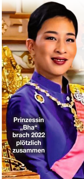
Prinzessin „Bha“ brach 2022 plötzlich zusammen

Thailand trauert. Die älteste Tochter von König Maha Vajiralongkorn (73), auch bekannt als Rama X., verstarb „friedlich im King Chulalongkorn Memorial Hospital der Thailändischen Rotkreuzgesellschaft im Alter von 47 Jahren“, ließ der Palast verlauten. Vier Jahre lang lag Prinzessin Bajrakitiyabha im Koma, nachdem sie 2022 plötzlich beim Spaziergang zusammenbrach. Die Ursache sollen Herzprobleme, ausgelöst durch eine Infektion, gewesen sein. Seither kämpfte die Prinzessin, die früher als Thronfolgerin gehandelt wurde, um ihr Leben. Doch ihr Körper war zu schwach. Tausende nahmen in Bangkok am Trauerzug teil.