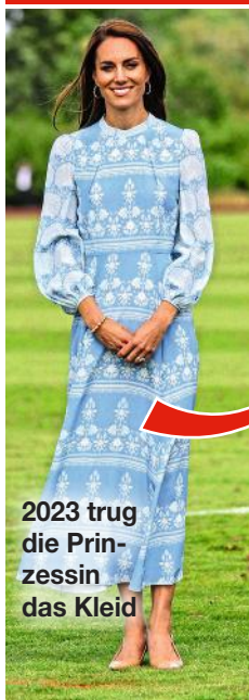
2023 trug die Prinzessin das Kleid