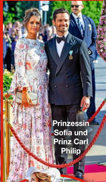
Prinzessin Sofia und Prinz Carl Philip