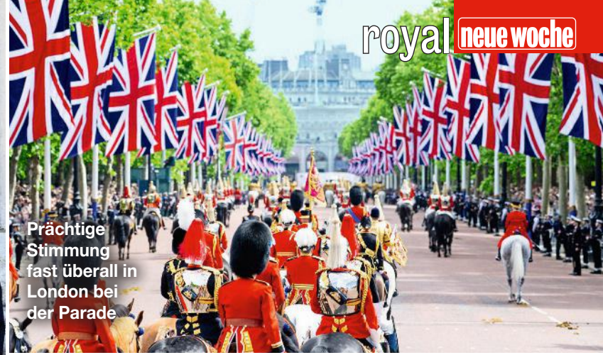
Prächtige Stimmung fast überall in London bei der Parade