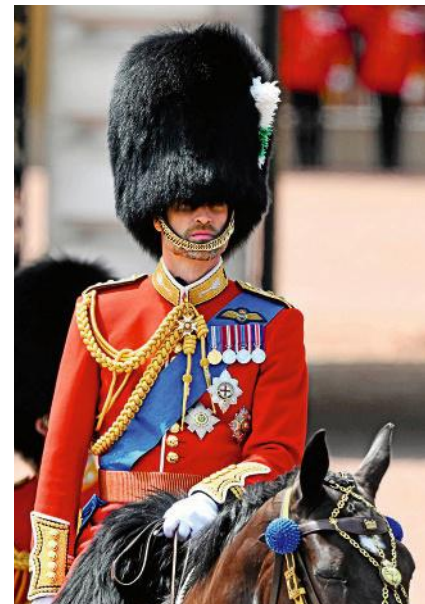
Grummelig wie ein Grizzly! William zog eine Schnute

Der Brite und die heutige Prinzessin von Wales waren 2001 für rund ein Jahr ein Paar, als beide an der St. Andrews Universität studierten. So weit, so unangenehm für William.