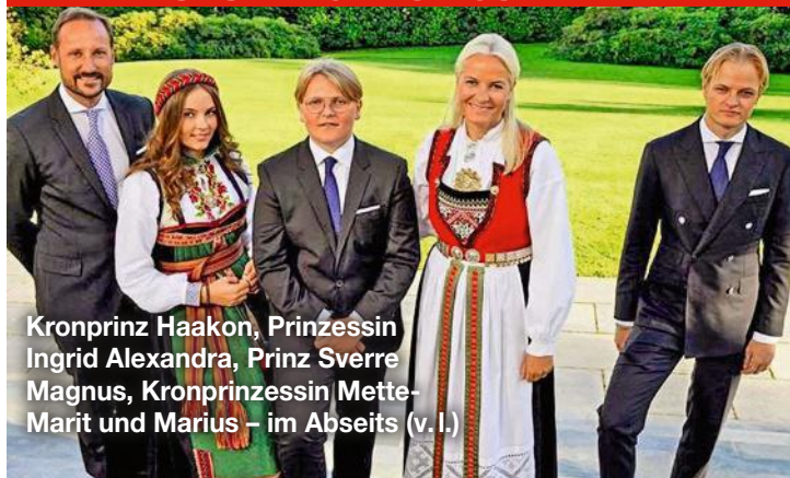
Kronprinz Haakon, Prinzessin Ingrid Alexandra, Prinz Sverre Magnus, Kronprinzessin Mette-Marit und Marius – im Abseits (v.l.)