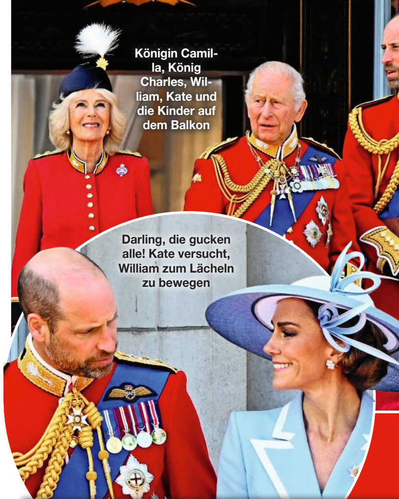
Königin Camilla, König Charles, William, Kate und die Kinder auf dem Balkon