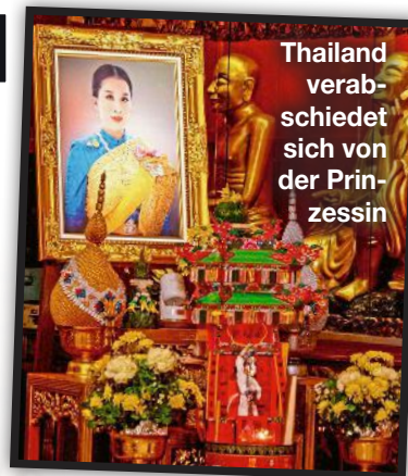
Thailand verabschiedet sich von der Prinzessin