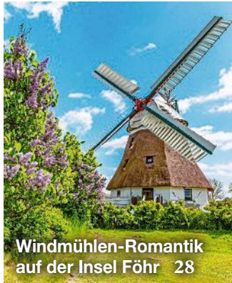
Windmühlen-Romantik auf der Insel Föhr 28