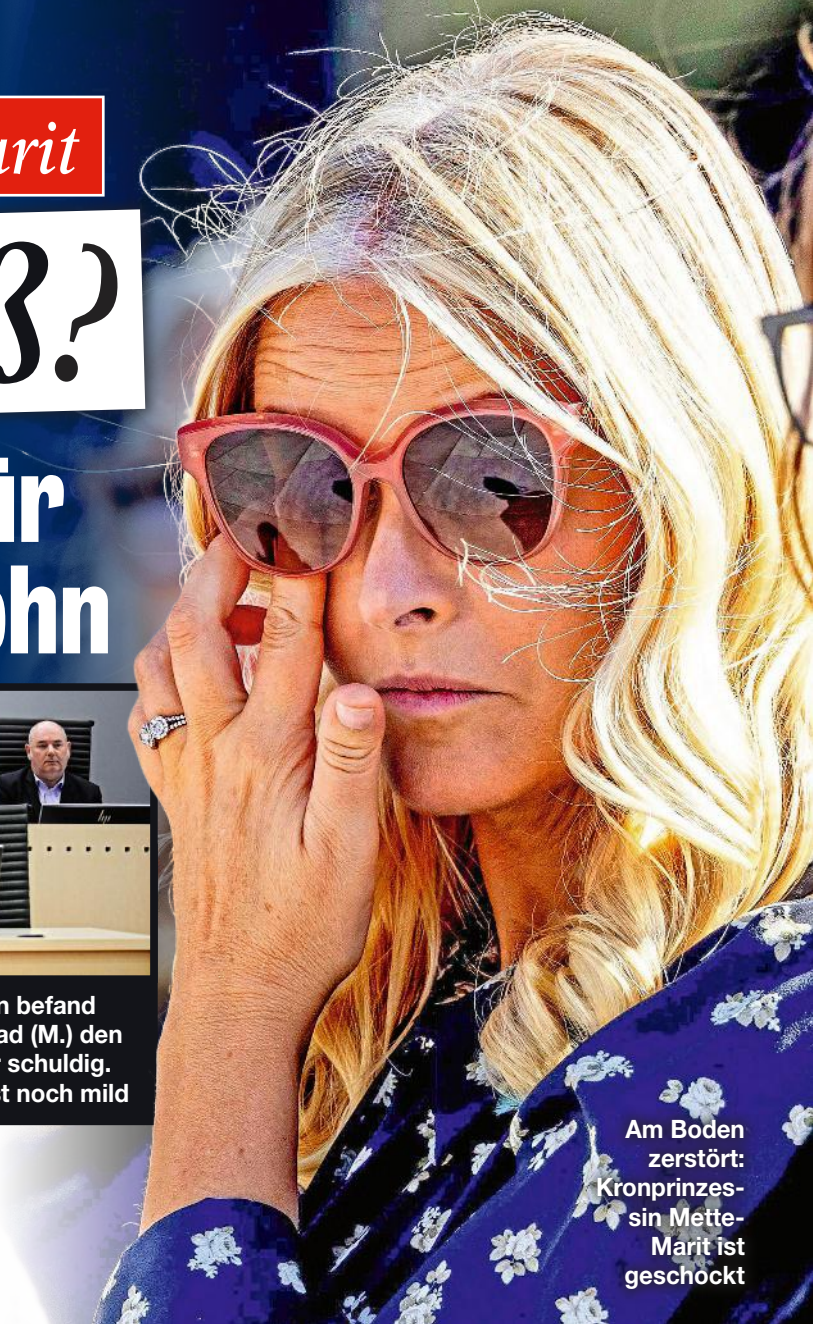
Am Boden zerstört: Kronprinzessin Mette-Marit ist geschockt

Mette-Marit, die derzeit auf der Warteliste für eine Lungentransplantation steht und sich aus der Öffentlichkeit zurückgezogen hat, ist jetzt offiziell die Mutter eines verurteilten Vergewaltigers. Kann sie mit solch einem „Titel“ überhaupt noch