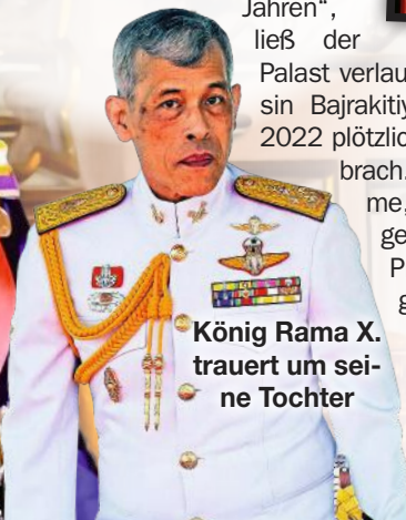
König Rama X. trauert um seine Tochter