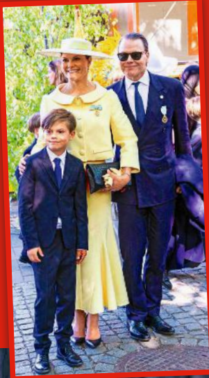
Ohne Estelle, die auf Sprachreise war: die Thronfolger-Familie