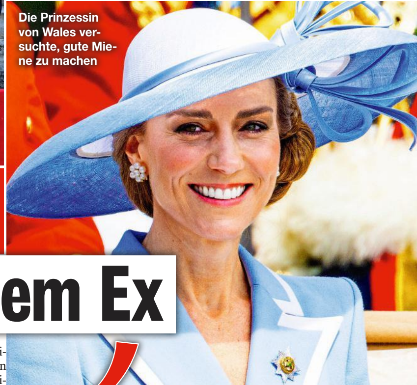
Die Prinzessin von Wales versuchte, gute Miene zu machen