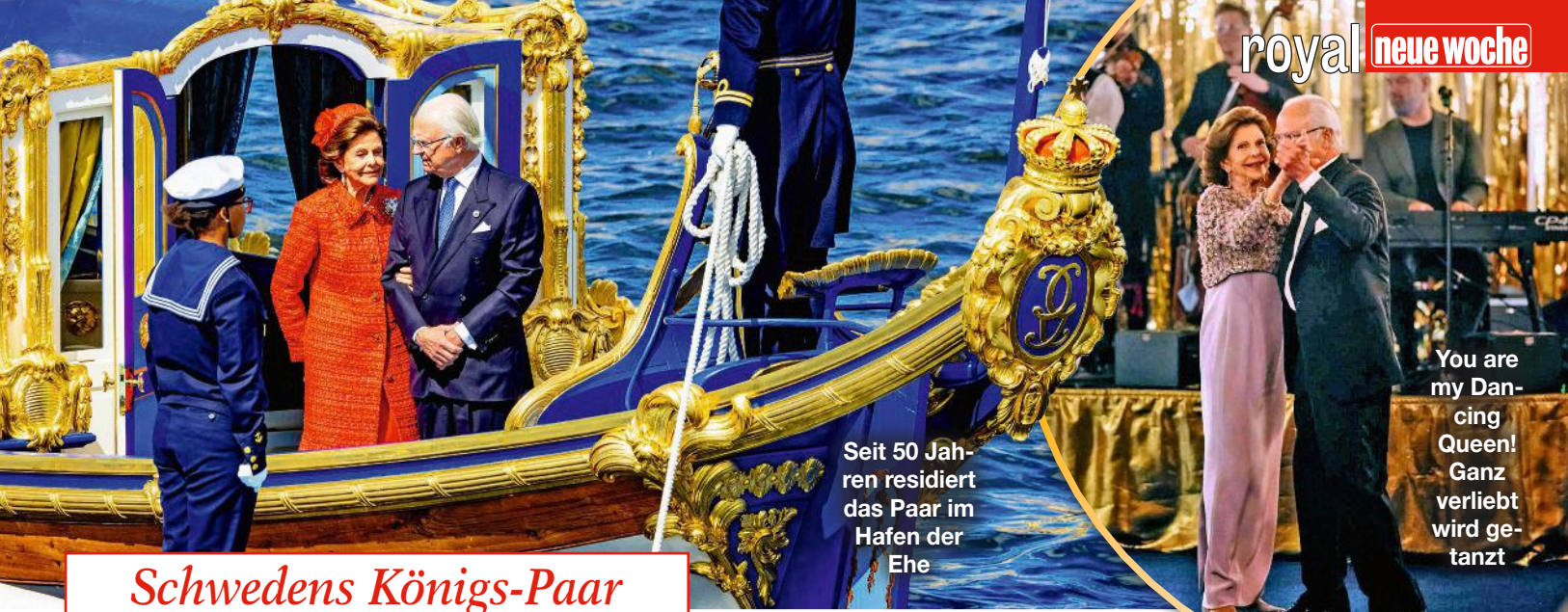
Seit 50 Jahren residiert das Paar im Hafen der Ehe