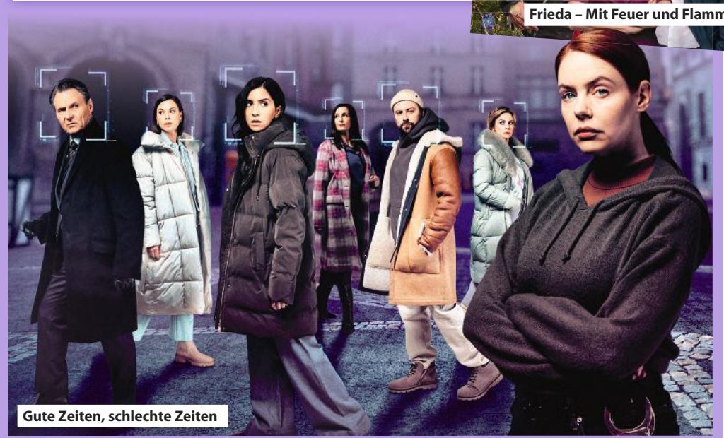
Gute Zeiten, schlechte Zeiten