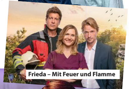
Frieda – Mit Feuer und Flamme