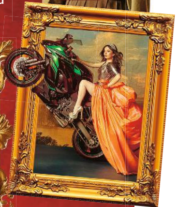
Eine fiktionale Prinzessin: „Su Majestad“