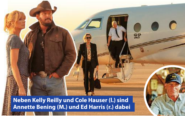
Neben Kelly Reilly und Cole Hauser (l.) sind Annette Bening (M.) und Ed Harris (r.) dabei

■ Mit „Dutton Ranch“ zeigt Paramount+ ab dem 15. Mai ein weiteres Sequel zur Serie „Yellowstone“! Beth Dutton (Kelly Reilly) und Rip Wheeler (Cole Hauser) wagen einen Neuanfang in Texas. Neu im Ensemble: Annette Bening als mächtige Farmerin und Ed Harris als einfühlsamer Tierarzt und Veteran.