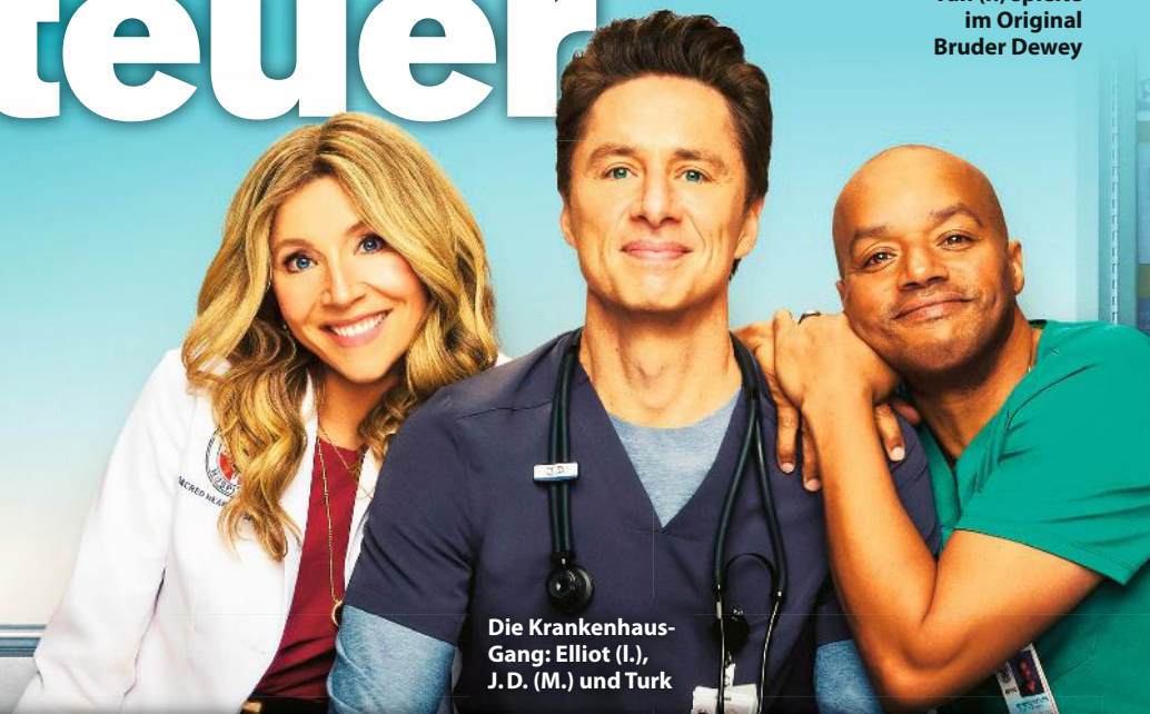
Die Krankenhaus-Gang: Elliot (l.), J.D. (M.) und Turk

War früher wirklich alles besser? Viele Serien- und Filmklassiker erleben gerade ihr Revival