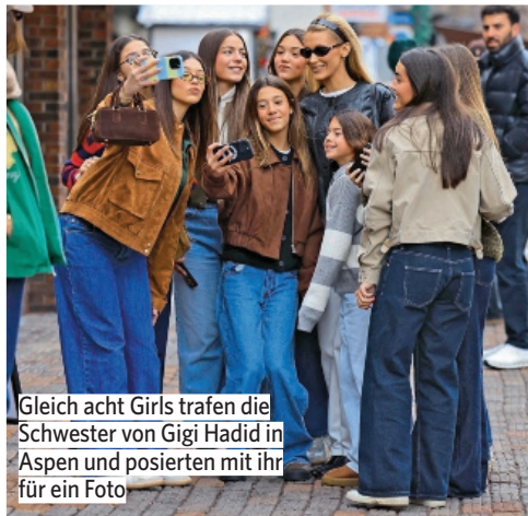
Gleich acht Girls trafen die Schwester von Gigi Hadid in Aspen und posierten mit ihr für ein Foto