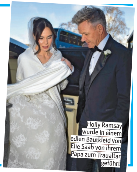
Holly Ramsay wurde in einem edlen Bautkleid von Elie Saab von ihrem Papa zum Traualtar geführt

Hochzeit der Extraklasse im britischen Bath: Gordon Ramsays Tochter Holly (25) hat ihren langjährigen Freund, den britischen Olympias-Star Adam Peaty (31), geheiratet. Der Starkoch führte seine Zweitälteste zum Altar, und auch die Beckhams gehörten zu den prominenten Gästen, die unter anderem gebratenen Wildhecht und Tarte Tatin serviert bekamen. Ramsay postete sentimental: „Ich bin wirklich sehr glücklich, diese wunderschöne Braut zum Altar führen zu dürfen und den unglaublichen Schwiegersohn Adam zu bekommen!“