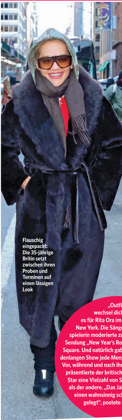
RITA ORA (35)

Flauschig eingepackt: Die 35-jährige Britin setzt zwischen ihren Proben und Terminen auf einen lässigen Look