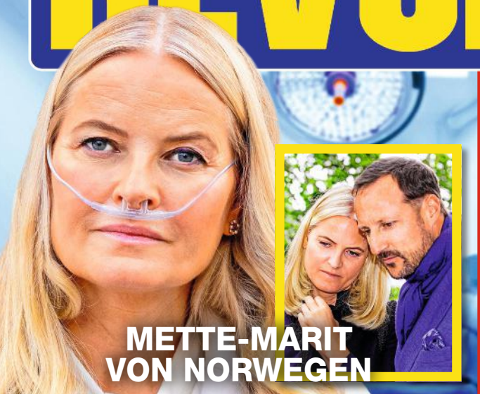
METTE-MARIT VON NORWEGEN

Griechenland 3,60 € Finnland 3,90 € Dänemark 28,95 dkr Großbritannien 3,80 € Slowenien 3,40 € Ungarn 1550 HUF Kroatien 3,40 € Printed in Germany