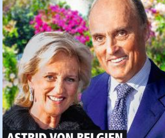
ASTRID VON BELGIEN

Bewundernswert, wie sie gegen die tödliche Krankheit kämpft!