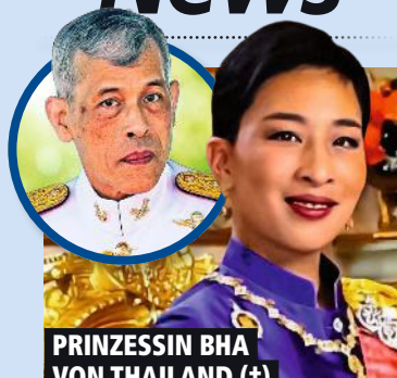
PRINZESSIN BHA VON THAILAND (†)