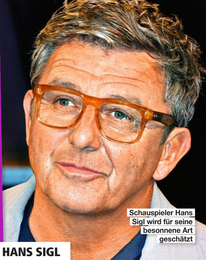
Schauspieler Hans Sigl wird für seine besonnene Art geschätzt