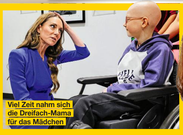
Viel Zeit nahm sich die Dreifach-Mama für das Mädchen

Die Besuche auf Krebsstationen verlangen Prinzessin Kate (44) viel Kraft ab. Jedes Mal wird die Frau des Thronfolgers dabei an die eigene Therapie und emotionale Achterbahnfahrt erinnert: Die schockierende Krebsdiagnose (2024) und die Zeit des Hoffens und Bangens danach stecken ihr nach wie vor in den Knochen. Verständlich, dass man all das Leid nach der Remission hinter sich lassen will. Umso bewundernswerter, wie tapfer Kate weiter gegen die tödliche Krankheit kämpft!