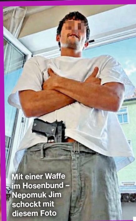
Mit einer Waffe im Hosenbund – Nepomuk Jim schockt mit diesem Foto

■ Bestürzt enthüllt Lukas Podolski (41), dass seine geliebte Oma Helene nach ihrem Tod in einem Kölner Krankenhaus beklaut wurde. Schmuck und Ehering – weg. Poldi: „Ein Skandal!“ Die Klinik schweigt.